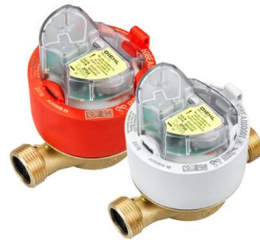
Мал. 3 Лічильник води