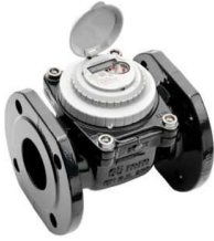
Мал. 3 Лічильник води