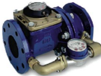
Рис. 1 Лічильник води MWN / JS-S

* Цей ТЕХНІЧНИЙ ПАСПОРТ ПРИЛАДУ складено виробником APATOR POWOGAZ S.A., м. Познань, Польща, та постачається до кожного приладу. В зв'язку з неможливістю нанесення на лічильному механізмі знаку відповідності та додаткового метрологічного маркування, таке маркування наноситься на супровідні документи (п. 62 Технічного регламенту засобів вимірювальної техніки, затверджений постановою КМУ від 24 лютого 2016 р. № 163.).