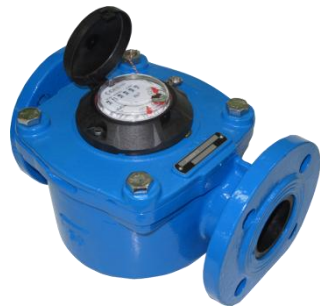
Рис. 2 Лічильник води JS