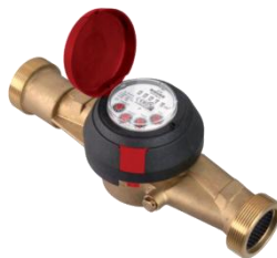
Рис. 2 Лічильник води JS130