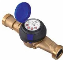
Рис. 2 Лічильник води JS